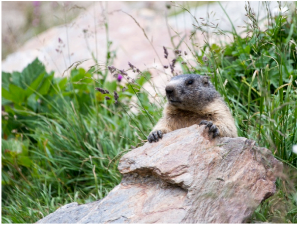
Fig. 4: Marmotte surveillant les environs.