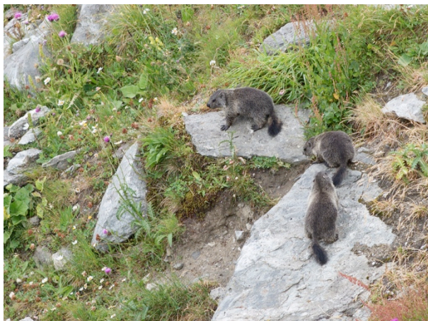
Fig. 3: Groupe familial à proximité du terrier.