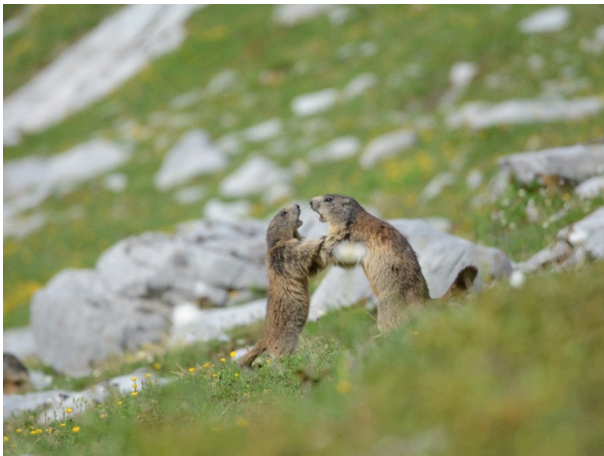
Fig. 6: Deux marmottes en plein combat.