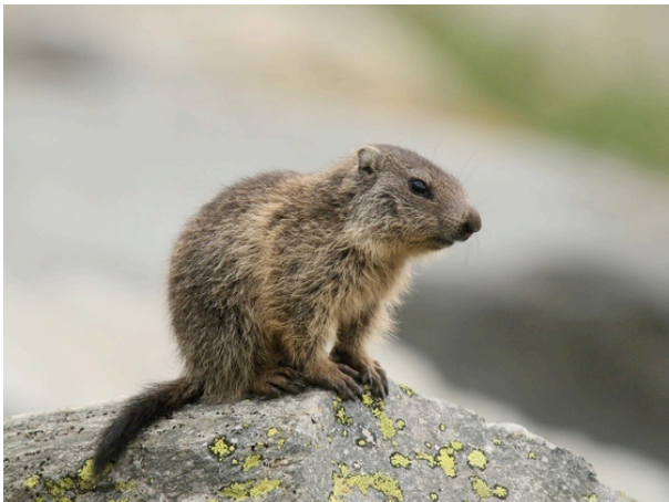
Fig. 7: Jeune marmotte.