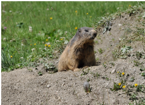
Fig. 2 : Marmotte regardant hors de son terrier.