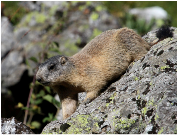
Fig. 5: Marmotte prenant le soleil pour se débarrasser de ses parasites.